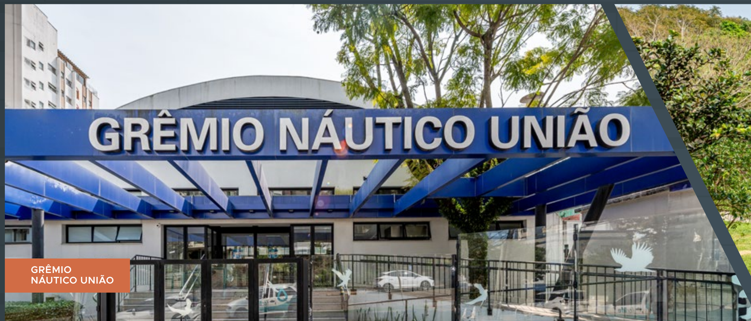
GRÊMIO NÁUTICO UNIÃO