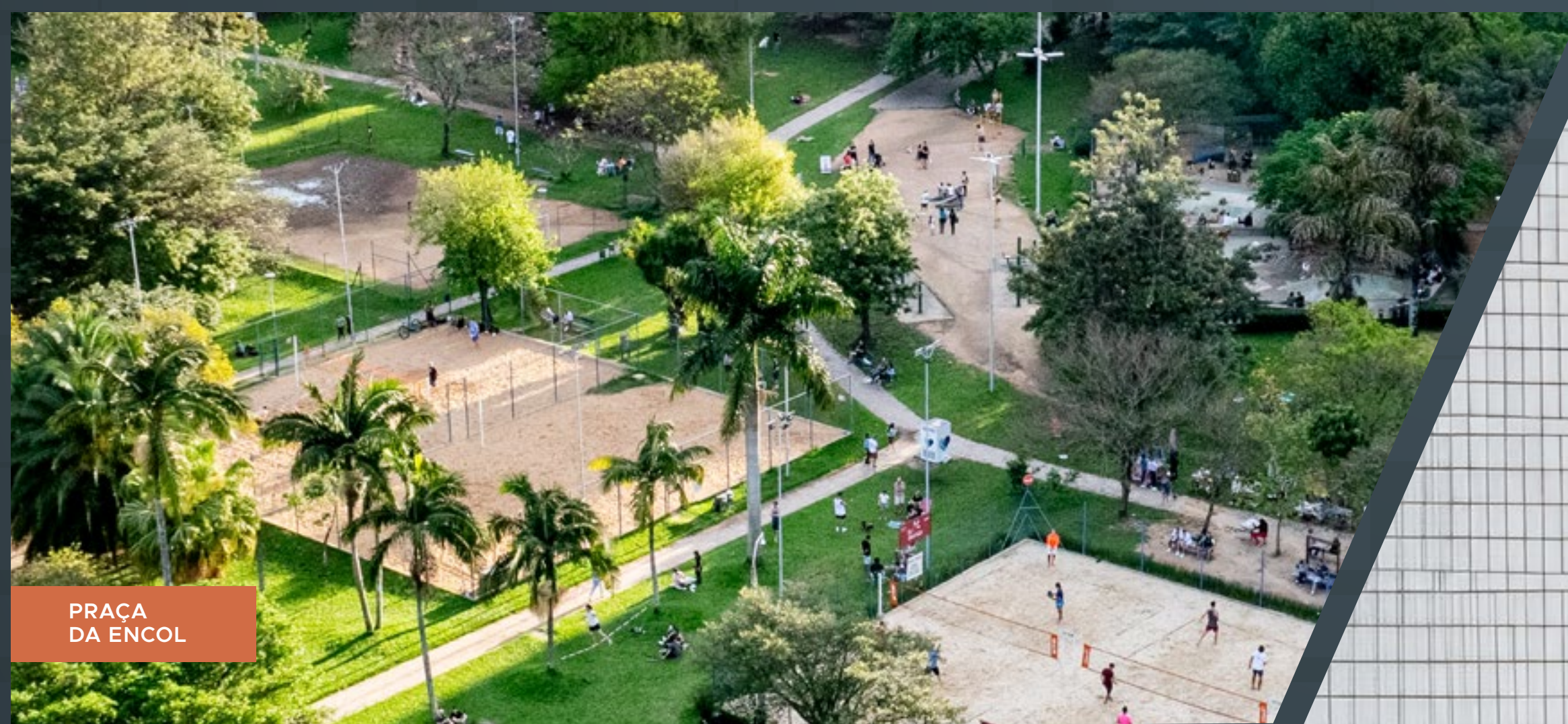
PRAÇA DA ENCOL