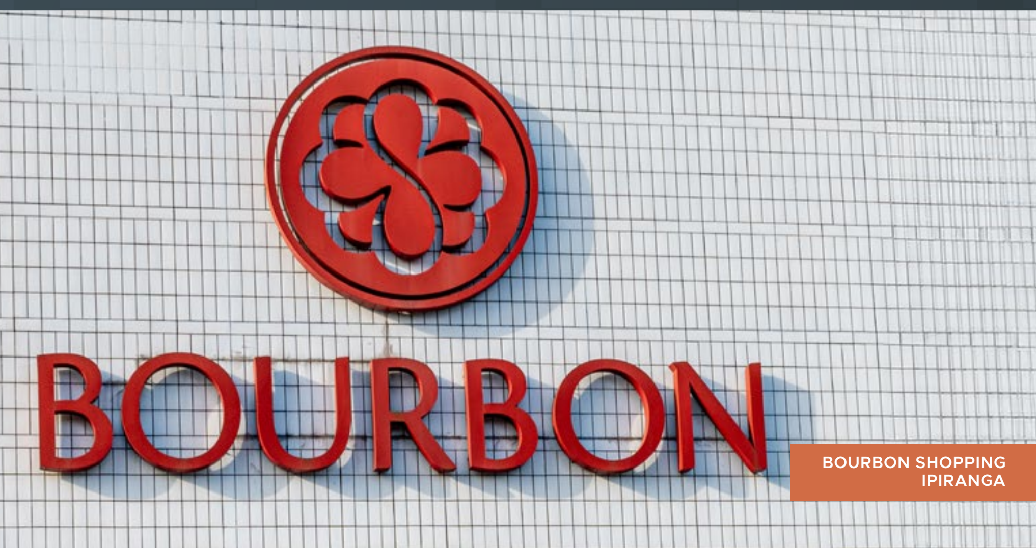
BOURBON SHOPPING IPIRANGA