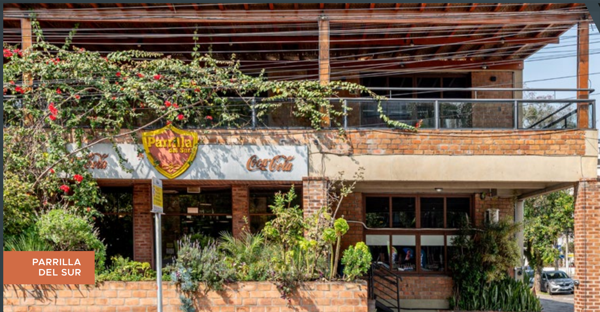
PARRILLA DEL SUR