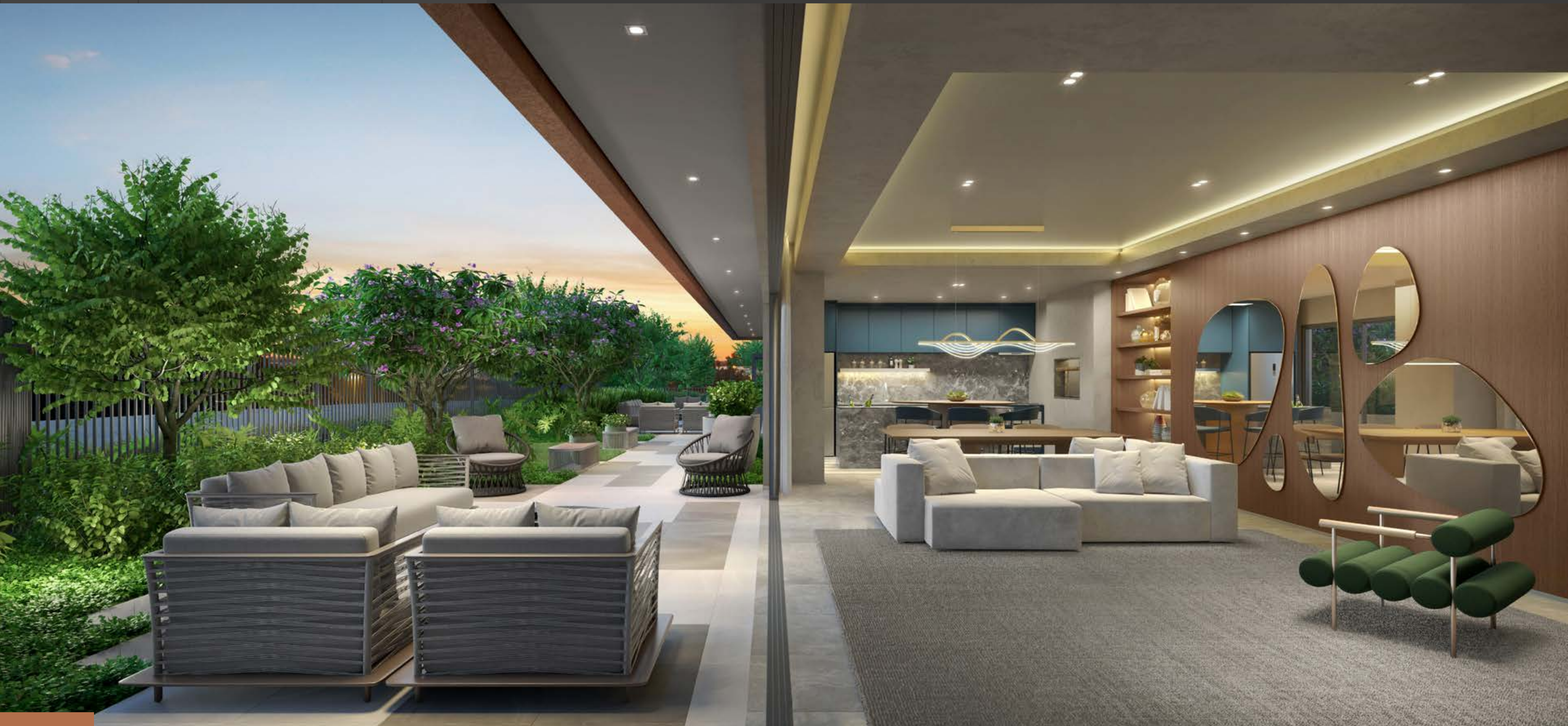
ESPAÇO GOURMET COM LOUNGE EXTERNO