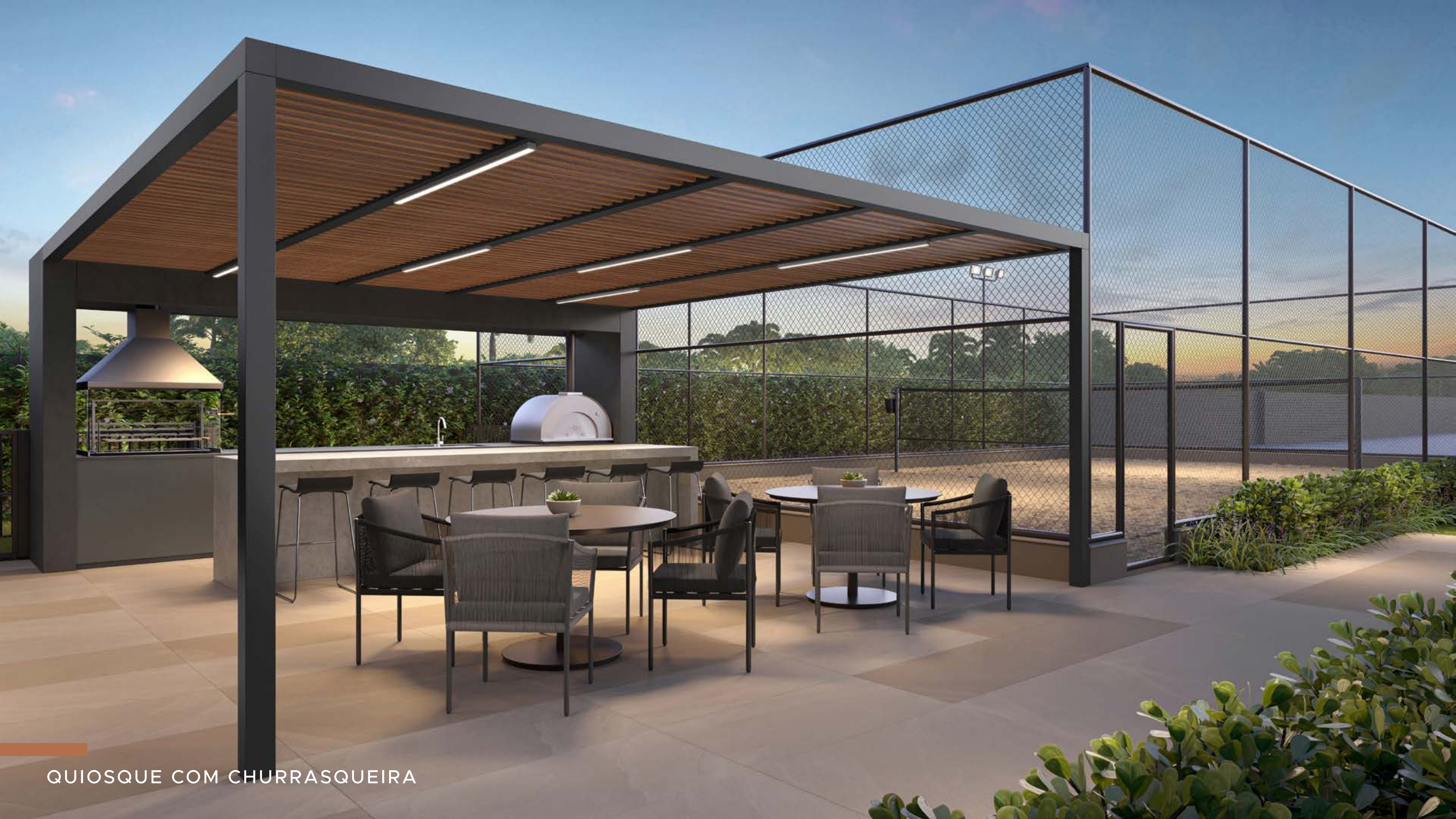
QUIOSQUE COM CHURRASQUEIRA