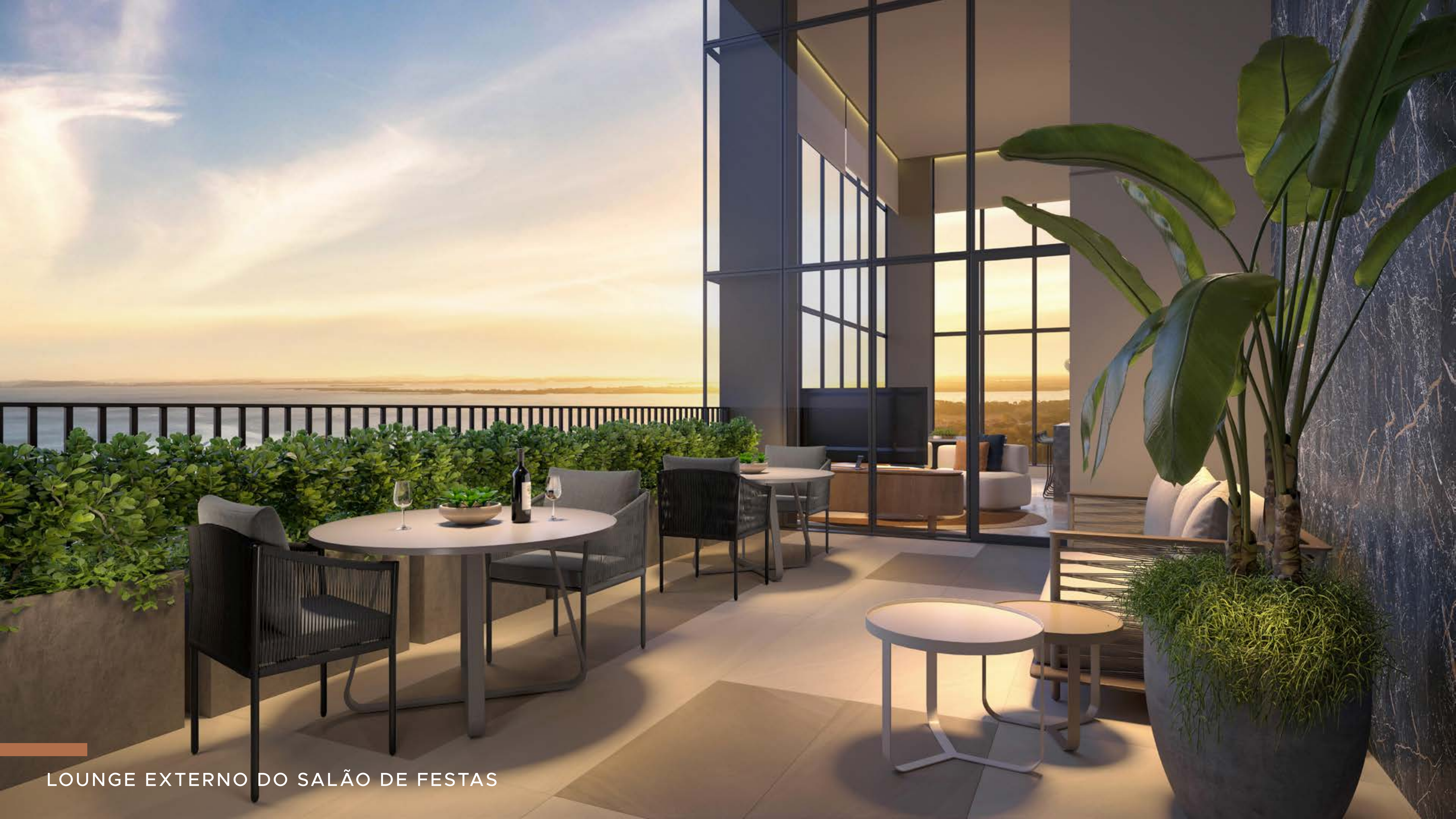
LOUNGE EXTERNO DO SALÃO DE FESTAS