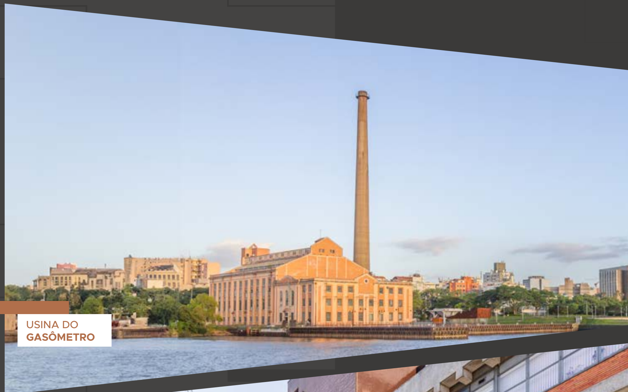
USINA DO GASÔMETRO