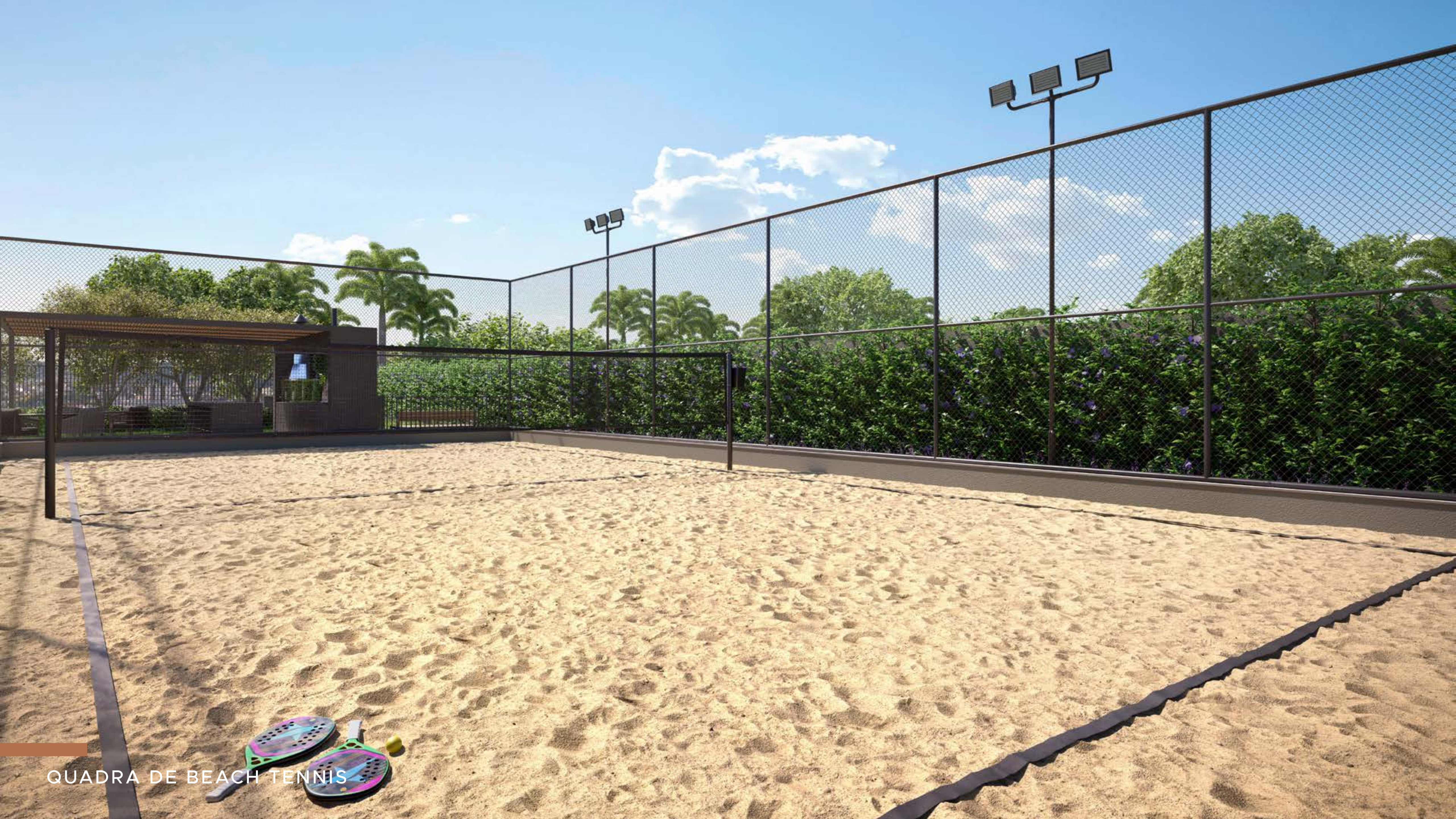
QUADRA DE BEACH TENNIS