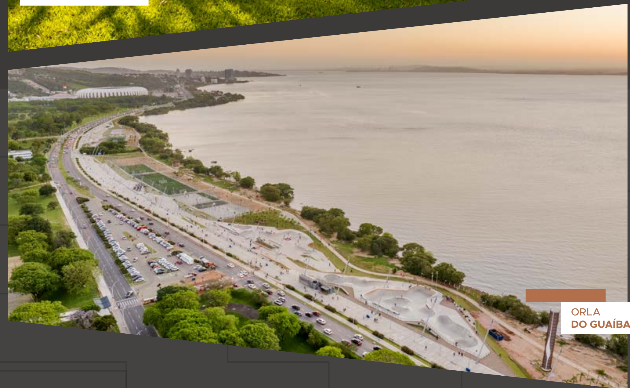
ORLA DO GUAÍBA