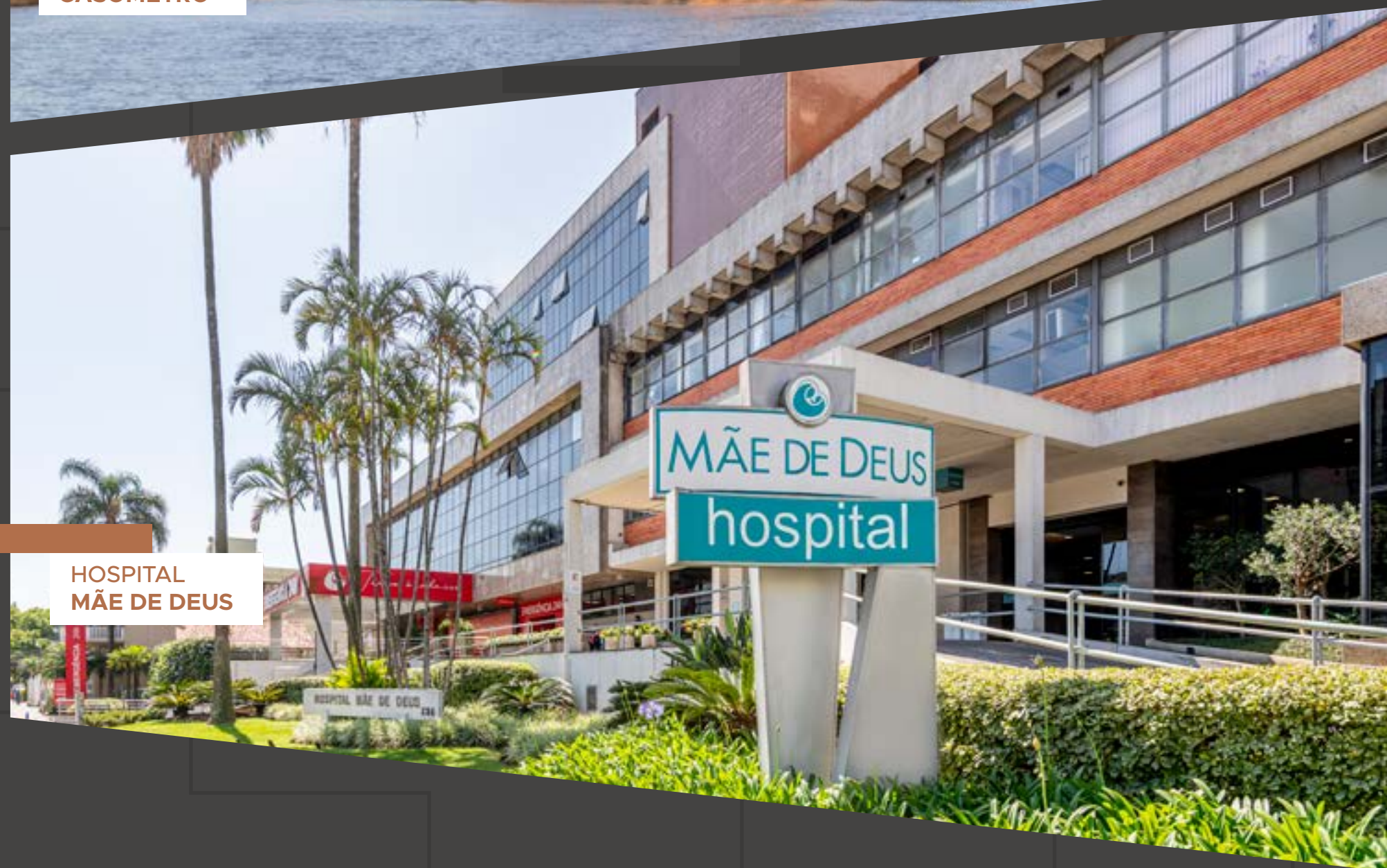
HOSPITAL MÃE DE DEUS