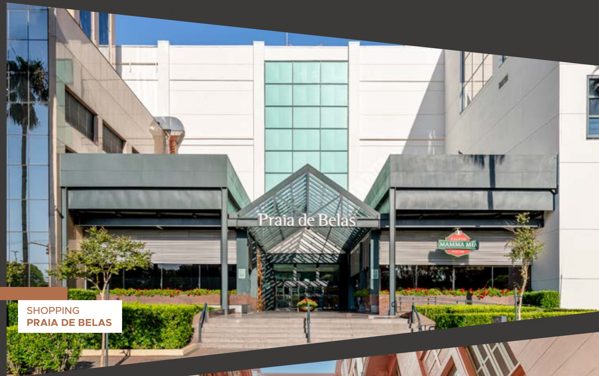
SHOPPING PRAIA DE BELAS