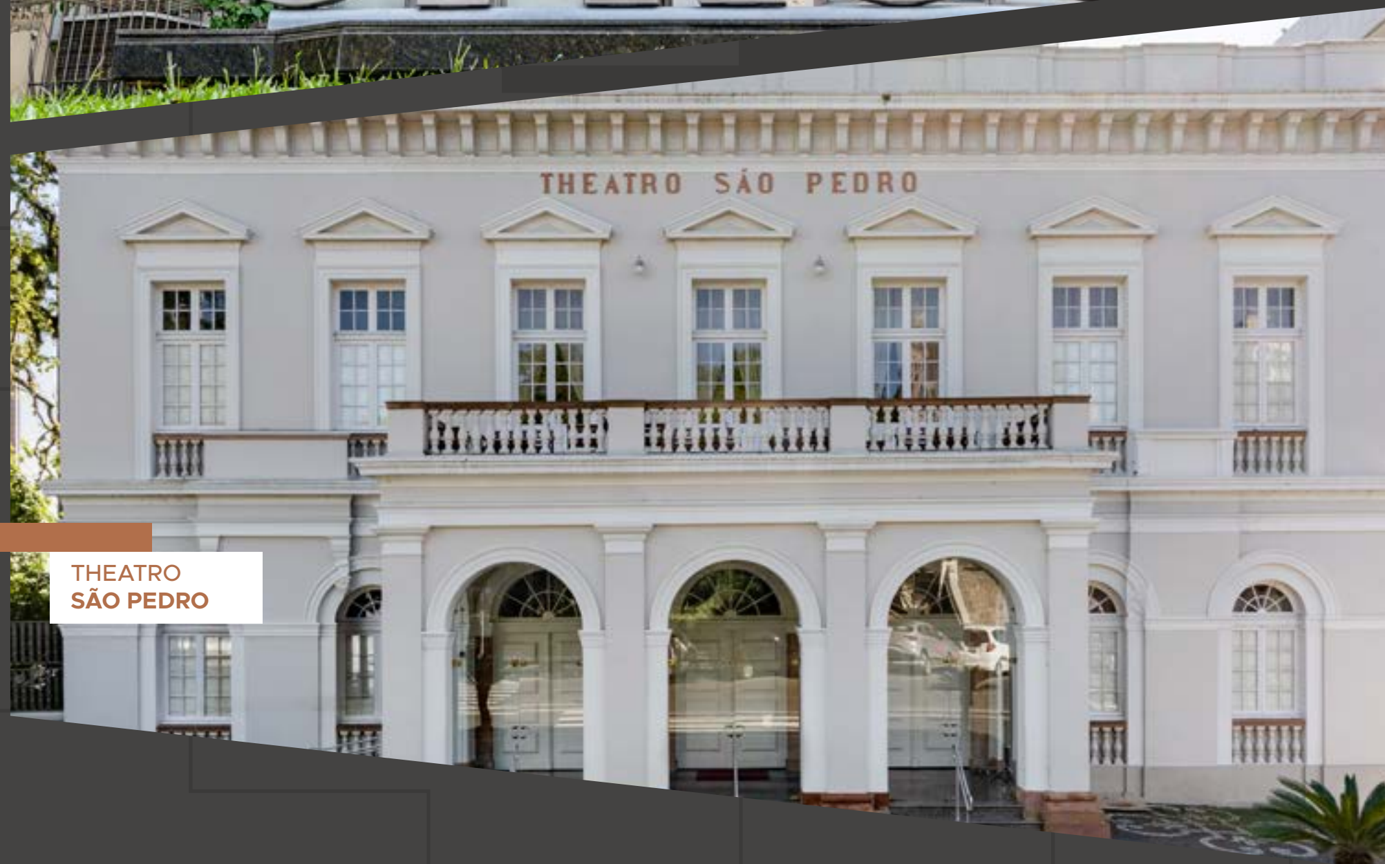
THEATRO SÃO PEDRO